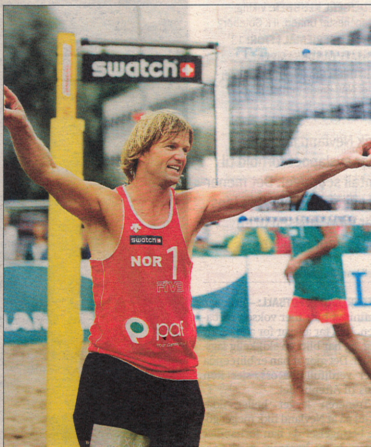
KUNNE JUBLE: Bjørn Maaseide og makker Iver Horrem sjokkerte med 2-0-seier over Kina, som er seedet på 1. plass i turneringen i Finland.

– Jeg har trent alternativt, og onsdag løstnet det litt. Jeg kjenner det i beina, men det går mer på antall kamper jeg spiller. Det er ikke kamplengden, men det å var-